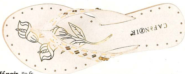
Café noir , 89 fr.