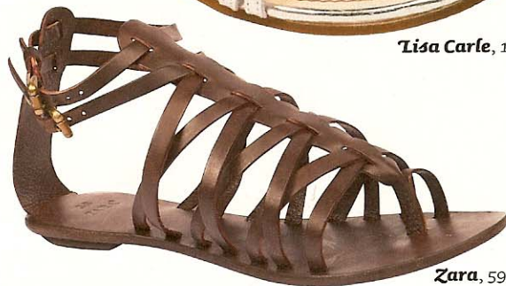
Zara , 59 fr. 90