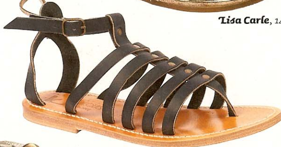
K. Jacques St-Tropez , 250 fr.