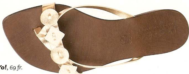
Yo! , 69 fr.